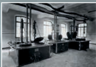
rok 1930 – varné kotle